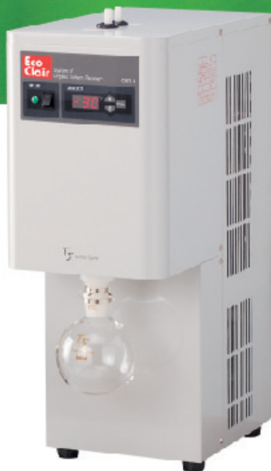
エコクレール OSR-B （卓上型）