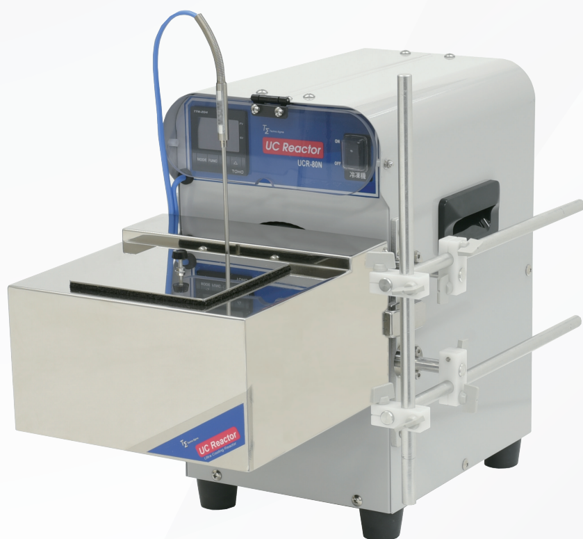
300mL フラスコ用液槽バス SUS センサー (EXTC-S01) 容器固定ステーセット (ST-010)